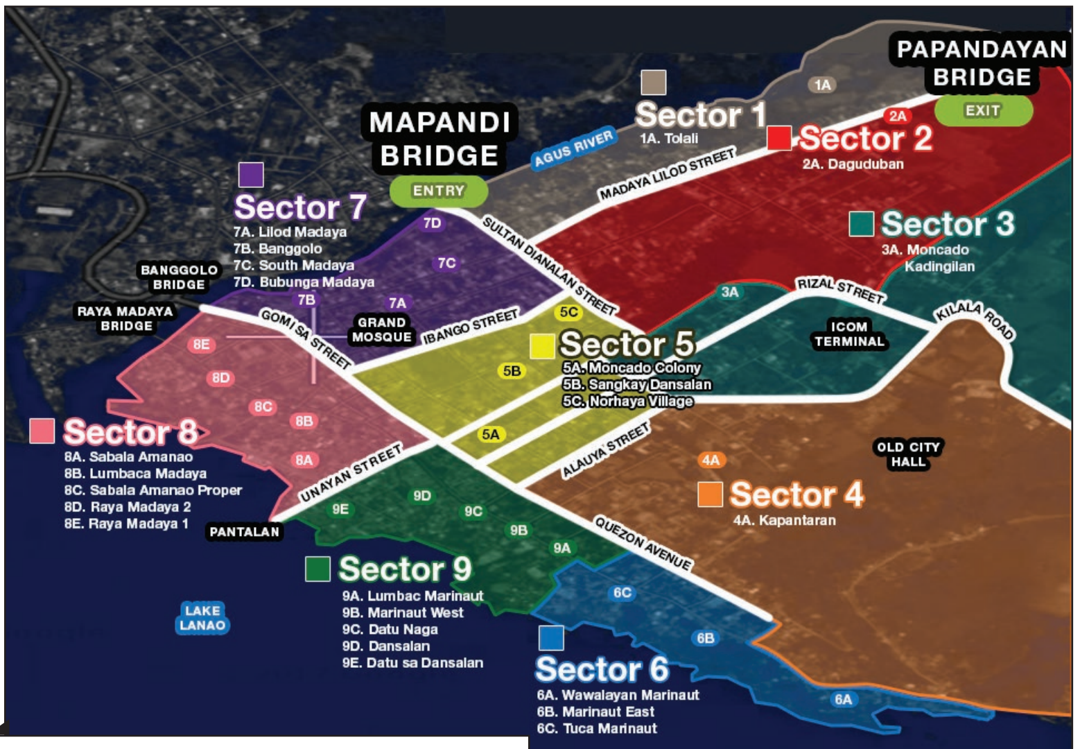
Takdang araw ng pagbisita (as of March 28, 2018)